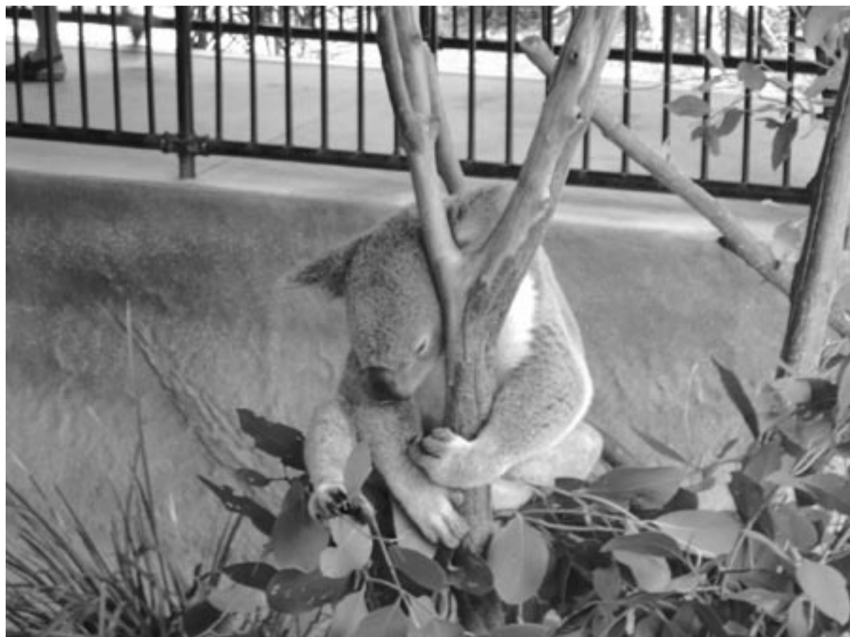
Koalabär in Australien – so schön kann ein Auslandspraktikum sein! Tolle Eindrücke und Erlebnisse, gleichzeitig wird die Reisebereitschaft und sprachliche Weiterbildung mit einem Job belohnt.

Nach erfolgreichem Abschluss des Studiums wollte ich erstmal etwas ganz Anderes machen und bin für drei Wochen auf eine archäologische Ausgrabung nach Israel gefahren, um mich anschließend in den Bewerbungsstress zu stürzen. Leider erwies sich das als etwas schwieriger als erwartet. Deshalb startete ich erst einmal in ein zweimonatiges Praktikum bei der NODIC GmbH in Prenzlau im Bereich digitaler Photogrammetrie. Nach dem Ende des Praktikums sammelte ich ein Jahr lang Erfahrung durch Projektarbeiten